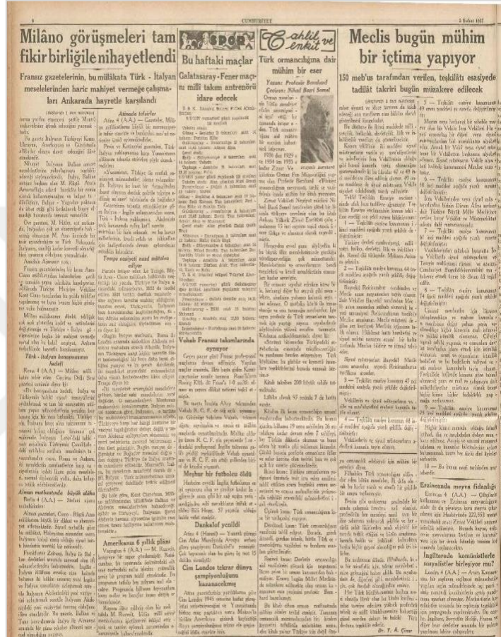
Şekil 16. Cumhuriyet Gazetesi (1937)

Prof. Bernhard'ın "Türkiye Ormancılığının Mevzuatı, Tarihi ve Vazifeleri" adlı önemli kitabı 5 Şubat 1937 yılında Cumhuriyet Gazetesi'ne konu olmuştur (Çınar, 1937) :