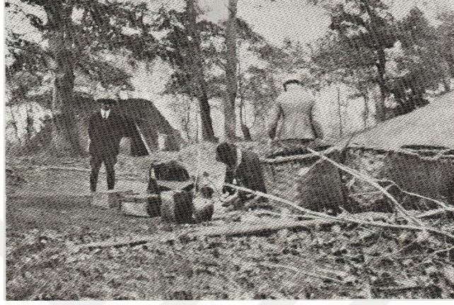
Şekil 12. Trakya'da yapmış olduğu gezintiden bir fotoğraf (Bernhard, 1935)

Bernhard Anadolu ve Trakya'nın sıradan yollarından uzak ormanlık alanlara zorlu yolculuklar yapmıştır (Bernhard,1940). 1927 yılında Trakya'ya yapmış olduğu gezintide (meşe baltalığında odunların istif edilmek suretiyle yapılan bir ocak) çekmiş olduğu bir fotoğraf Şekil 5'te gösterilmiştir.