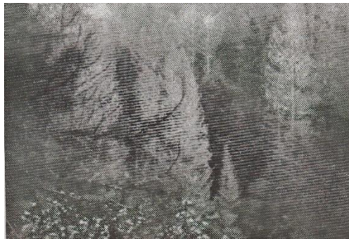
Şekil 9. Ips sexdentatus 'un Ladin ormanlarındaki tahribat (Bernhard, 1935)

Bernhard 1928 yılında Trabzon, Rize, Gümüşhane, Giresun illerini dolaşmış ladin ormanlarını gezmiş ve bu ladin ormanlarına zarar yapan böcekleri incelemiştir (Recep, 1929). Bu gezi ilerleyen böümlerde detaylı olarak incelenecektir. Bernhard'ın 11.09.1928 yılında Santa yöresinde (Gümüşhane) gezerken çekmiş olduğu bir fotoğraf Şekil 3'te gösterilmiştir.