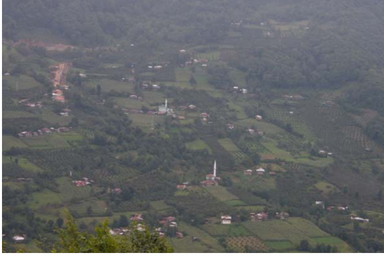
Şekil 6. Araştırma alanında yer alan Düzenli köyünün genel görünümü