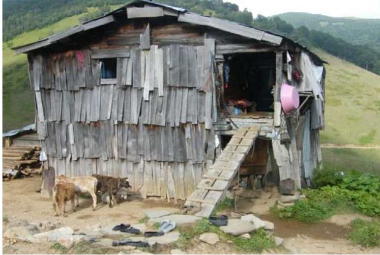
Şekil 7: Araştırma alanındaki evlerden bir görünüm Papart yaylası

Hayvanı olmayan aileler kış aylarında Borçka İlçesi'nde yaşamaktadırlar. Bu aileler ilkbaharda tekrar köylerine dönüş yapmaktadırlar. Genellikle ailelerin 1-2 inekleri bulunmaktadır. Yörede tarihi süreç içinde "halk ekonomisinin" hayvancılığa dayandığı bilinmektedir. Eskilerde her ailede -çok sayıda-büyük baş, küçükbaş ve kümes hayvanları olmuştur! Bugün ise; göç hareketlerine hayvancılığın pazar olanaksızlıklarının eklenmesi nedeniyle yörede hayvancılık gerilemiştir. Bölgede kırmızı benekli alabalık (dağ alası) türü bulunmaktadır. Kırmızı benekli alabalık (dağ alası) yörenin karakteristik (simge) özelliklerinden biri olarak önemlidir. Yörede geleneksel yöntemlerle binlerce yıldır arıcılık yapılmaktadır. Son yıllarda ana arı üretimi ve kara kovandan fenni kovana geçmek suretiyle, arıcılık faaliyetine hız verilmiştir.