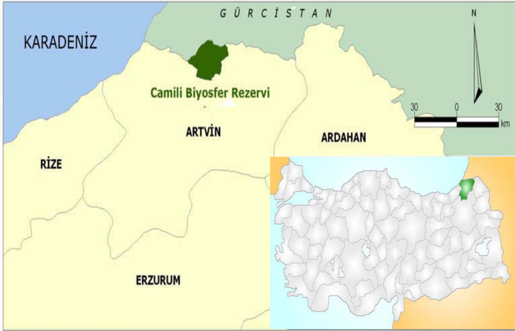
Şekil 4. Araştırma Alanının Haritada Gösterimi

Bu bölüm altındaki bilgiler için, “Türkiye’deki Korunan Alanlarda Sürdürülebilir Kalkınma İçin Bir Araç Olarak Turizme Stratejik Yaklaşım Camili Biyosfer Rezerv Alanı Taslak Sürdürülebilir Turizm Gelişim Stratejisi”, “GEF-II Biyoloji Çeşitlilik ve Doğal Kaynak Yönetimi Camili Bölgesi Sosyal Değerlendirme Raporu” (Anomim, 2000) ve araştırma alanında yapılan gözlemler sonucu elde edilen veriler, kaynak olarak değerlendirilmiştir.