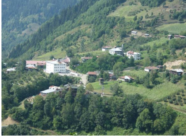
Şekil 5. Araştırma alanında yer alan Camili köyünün genel görünümü

Gürcistan ile Türkiye arasındaki kara sınırı boyunca "1. Derece Askeri Yasak Bölge" yer almaktadır. Bu bölgenin idare ve güvenliği Milli Savunma Bakanlığı'na bağlı görev yapan askeri birliklerin sorumluluğundadır. Sınırın Türkiye tarafındaki 600 m'lik askeri yasak bölge 2004 yılında Resmi Gazete'de yayınlanan Bakanlar Kurulu kararıyla 100 m'ye çekilmiştir. Artvin İli'nde yer alan Camili Havzası 25.395 ha'lık alanı ile UNESCO'nun "İnsan ve Biyosfer Ağı"na (MAB) 29 Haziran 2005 tarihinde Türkiye'nin ilk Biyosfer Rezervi olarak dâhil edilmiştir.