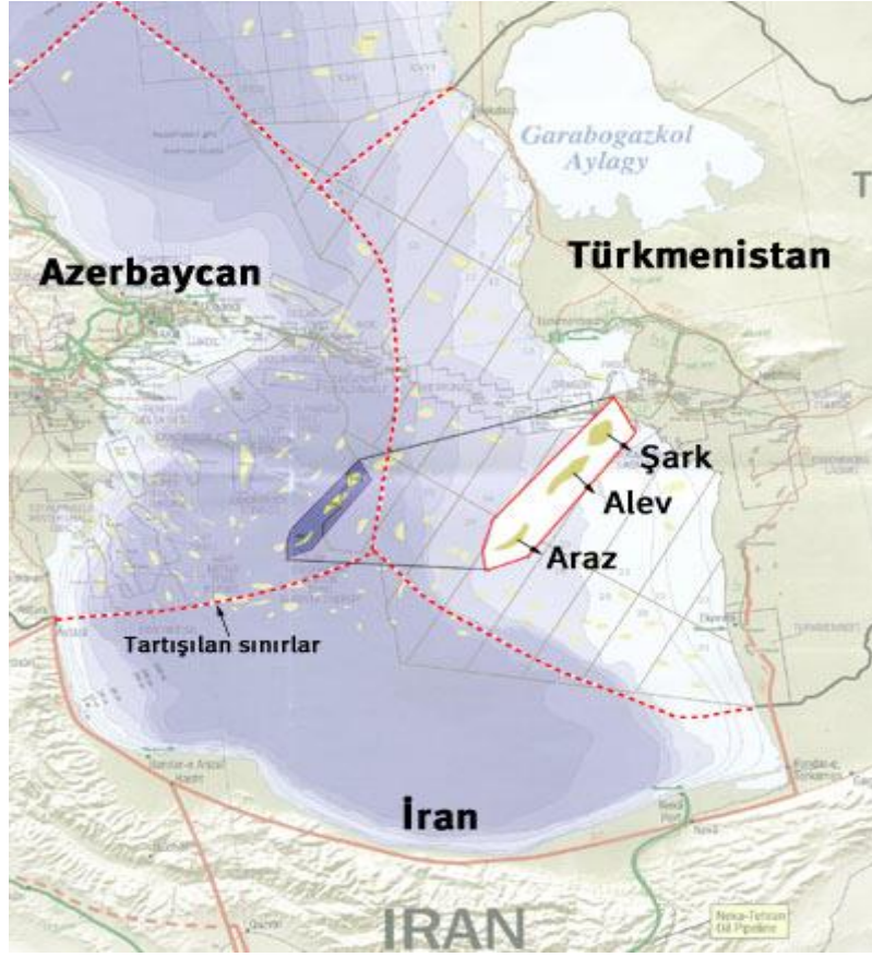
Şekil 4: Şerg-Alov-Araz Petrol Sahaları