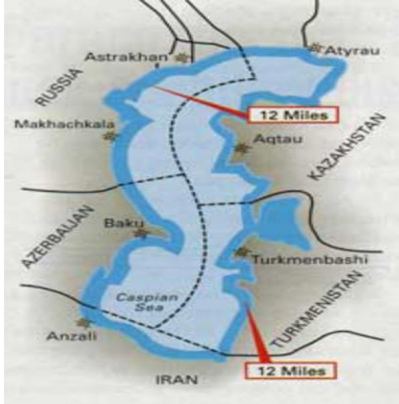
Şekil:3 Hazar'ın Paylaşımı için Türkmenistan'ın Önerisi