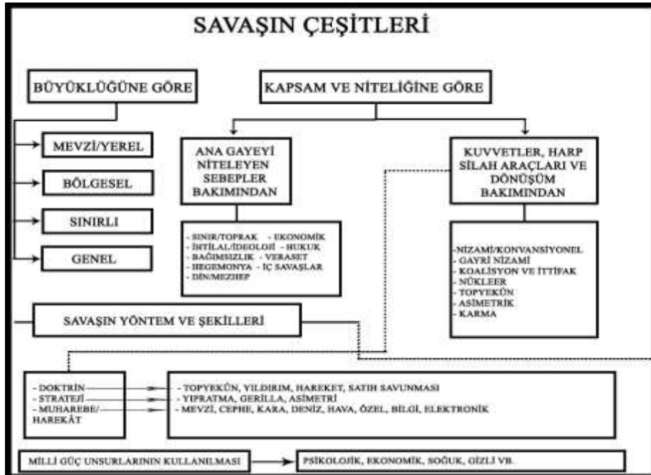
Şekil 1: Savaş Çeşitleri

Savaş olgusuna dair kaynaklarda tutarsızlıklar bulunmasının sebebi metodik araştırma öğelerindeki çeşitlilik nedeniyle savaşların incelenmesinde ve değerlendirilmesinde farklı neticelere varılmasıdır. Savaşın tasniflenmesi ile ilgili bazı kavramlar, zaman içerisindeki kullanılışları dolayısıyla girift bir hâl alır. Savaşların çoğunu birbirinden ayırarak vurgulama imkânı ortadan kalkar. Örnek olarak belirli coğrafya ile sınırlı olan savaşlar, az sayıda devletin katılımı ile gerçekleşen ya da konvansiyonel silahların kullanıldığı savaşlar, yaygın biçimde ‘sınırlı savaş’ biçiminde ifade edilir. Savaşla ilgili kelime ve terimlerin yaygın şekilde birbiri yerine kullanımında, kendine has şartlarda yapılan adlandırmaların sistematik bir yapı dâhilinde düzenlenmiş olması önemli ölçüde etkilidir. Buna göre yaygın biçimde kullanılan savaş, ‘büyüklüklerine göre’ ve ‘kapsam ve niteliklerine göre (Varlık, 2013: 121) iki temel gruba ayrılır: