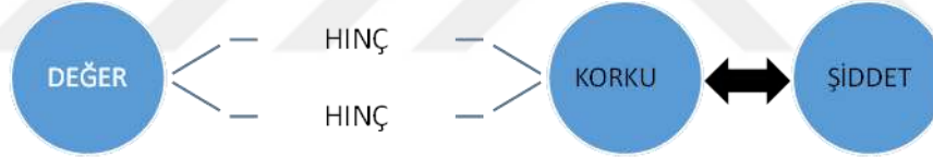
Şekil 3: Korku-Şiddet, Değer-Hınç Denklemi

Korku için şiddet, şiddetin oluşması için korku gereklidir; iç içe sarmal haline gelen bu iki kavramın karşı düzleminde değerler sistemi, paralel düzleminde hınç yer alır. Korku, şiddet ilişkisi çatışma durumunda değerler ile ilgilidir. Toplumsal olan korku ve şiddeti siyasi zeminde meşrulaştırmak kişinin tinsel-moral potansiyelini tümüyle kullanılmaz hâle getirir. Bu nedenle haklı savaşı, haksız savaştan meşru şiddeti, meşru olmayan şiddetten ayıran önemli faktör toplumsal hafızanın yarattığı değerlerin yok edilmesidir. Korku, şiddet ve hınç denkleminin çatışma esnasındaki kullanım biçimi, insani değerleri görmezden gelerek savaşın yıkıcı boyutunu belirler.