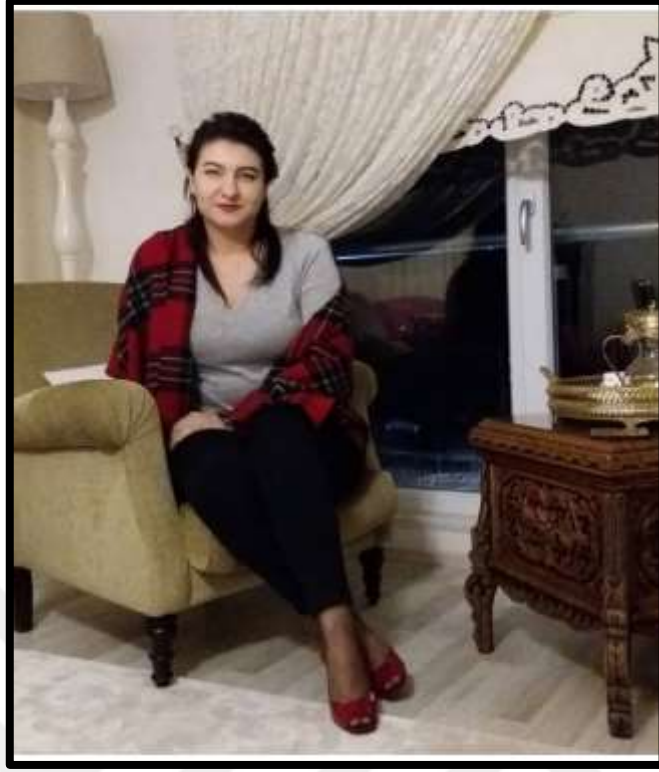
Kadınların misafirlikteki giyim ve oturma biçimlerine ait bir görünüm.