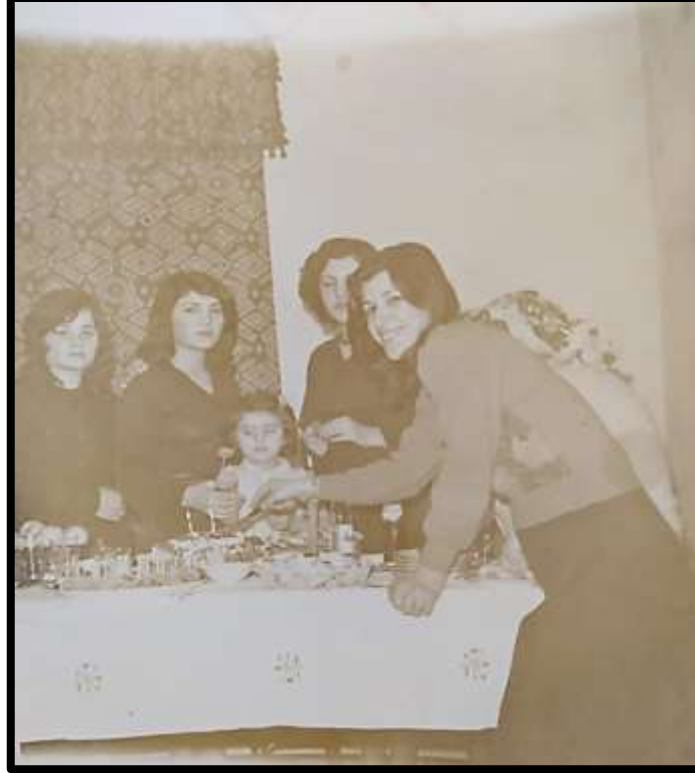
Evin kızlarına servis yapan geline ait bir görünüm.