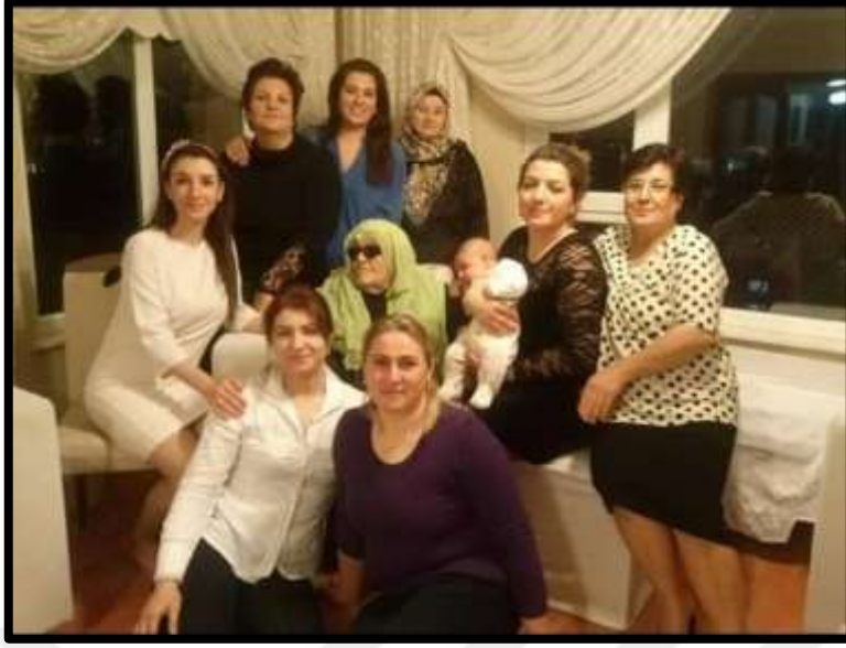
Kadın toplantılarına ait bir görünüm.