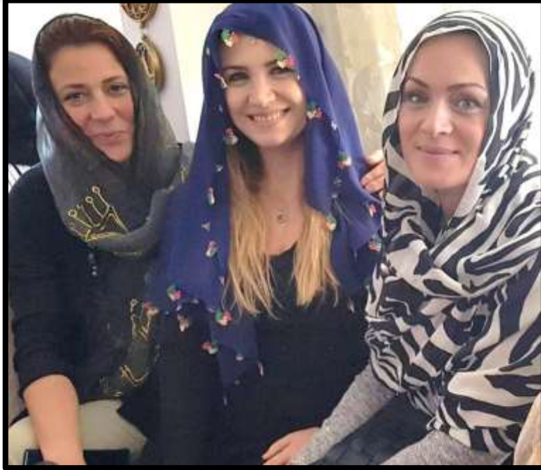
Mevlitlerde baş bağlama stillerinden bir görünüm.