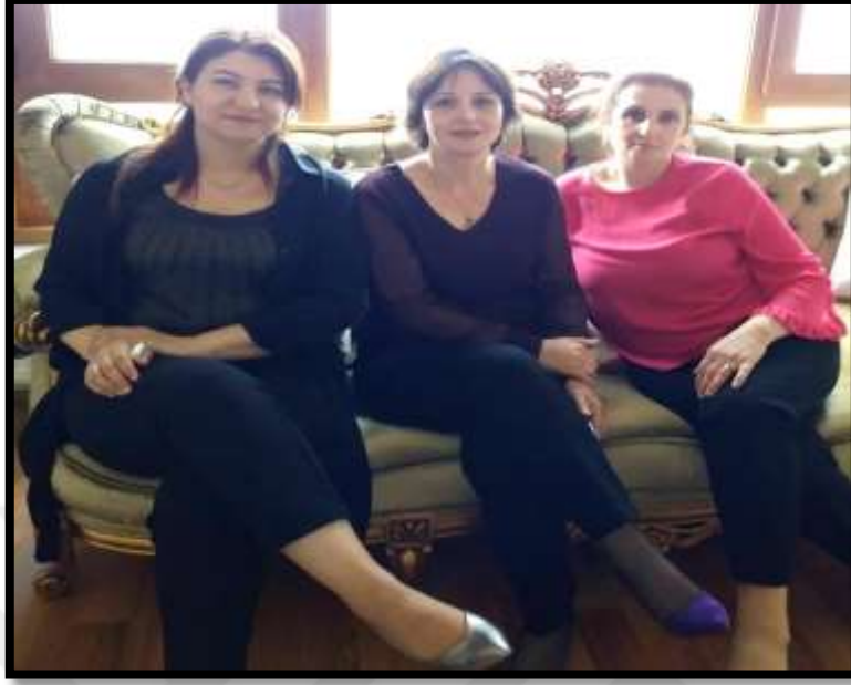
Kadınların yaygın oturuş biçimlerinden bir görünüm.