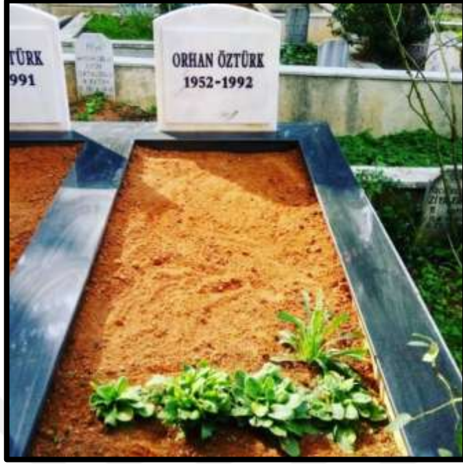
Yakınları tarafından özel günler öncesinde ziyarete hazır hale getirilmiş mezardan bir görünüm.