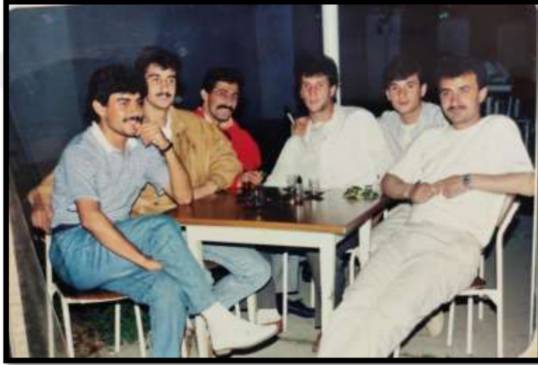
Erkeklerin oturuş biçimine ait bir görünüm.