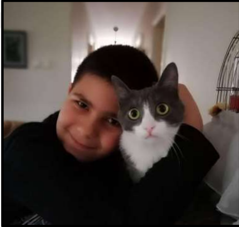
Çocuk ve hayvan ilişkisine ait bir görünüm.