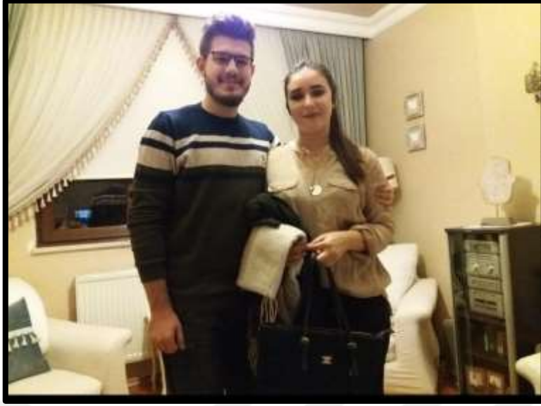
Yeni evli çiftin düğün sonrası gerçekleştirdiği akraba ziyaretlerine ait bir görünüm.