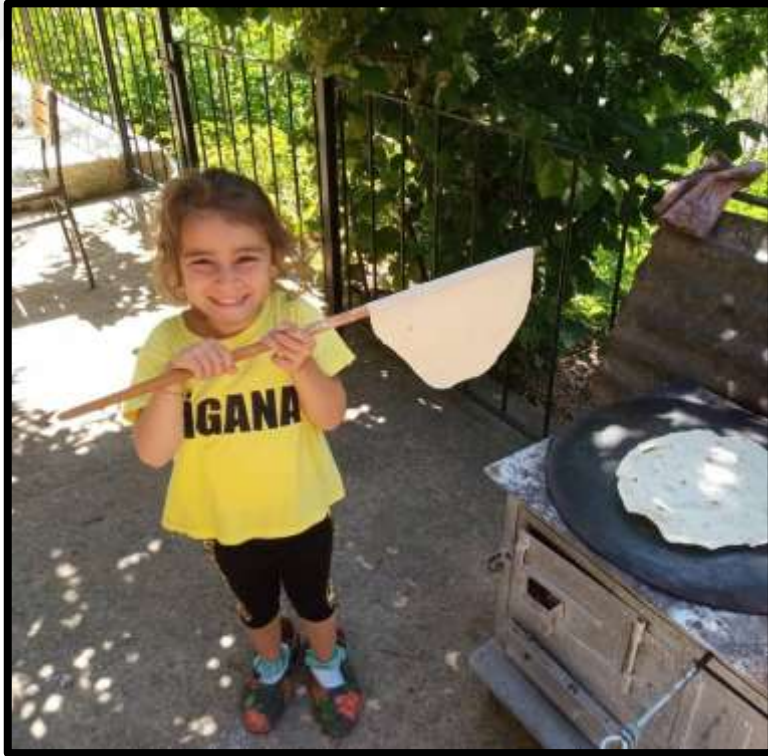
Mutfak işlerine yatkınlık kazanması adına yemek hazırlığı sürecine dâhil edilen kız çocuğuna ait bir görünüm.