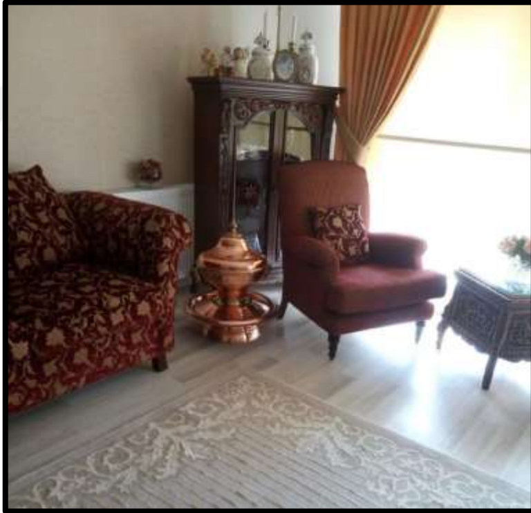
Misafir salonuna ait bir görünüm.