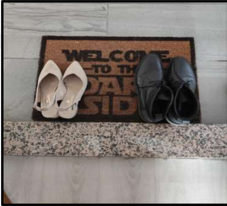
Misafirin dışarıya bakacak şekilde çevrilen ayakkabılarına ait bir görünüm.