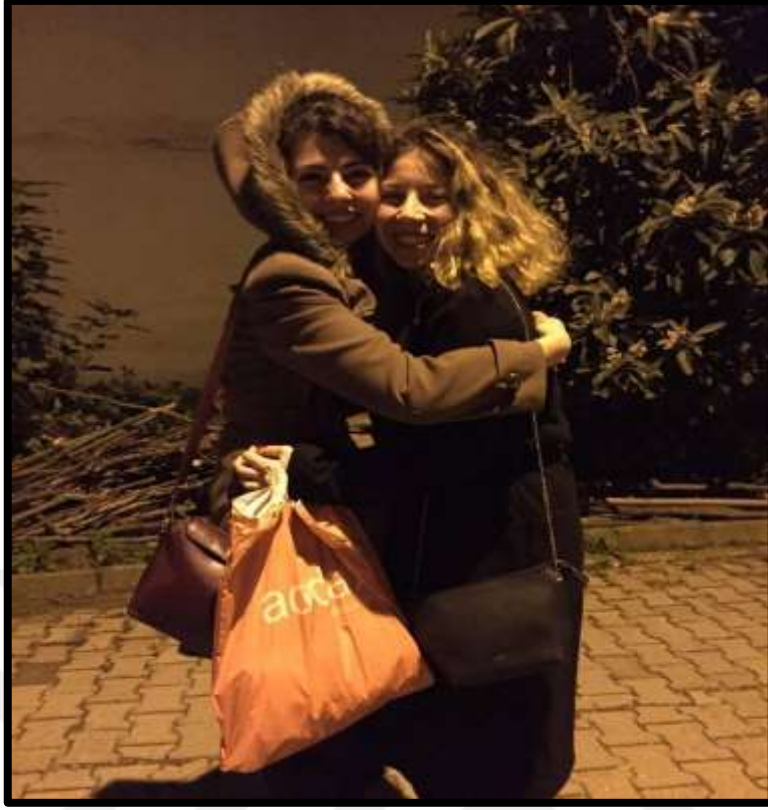
Gençler arasında selamlaşmaya ait bir görünüm.