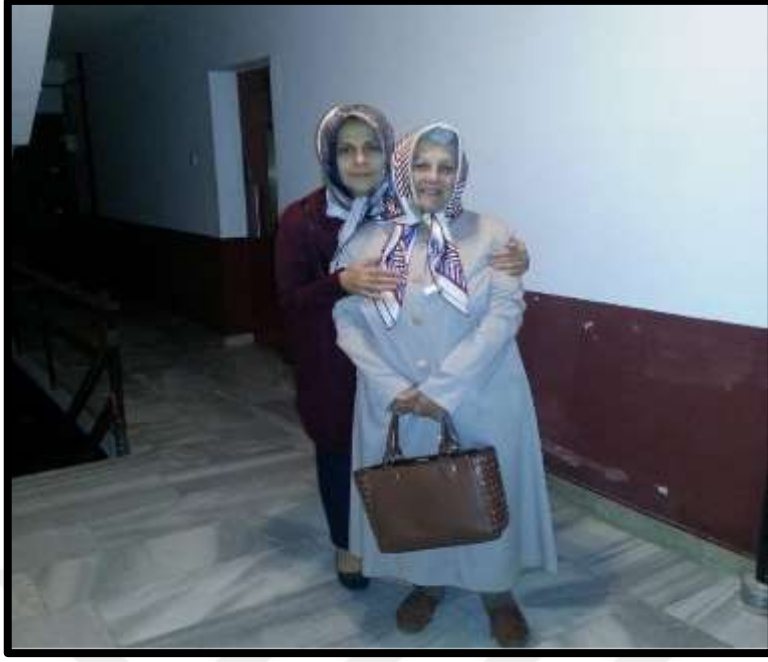
Baş bağlama ve manto stiline ait bir görünüm.