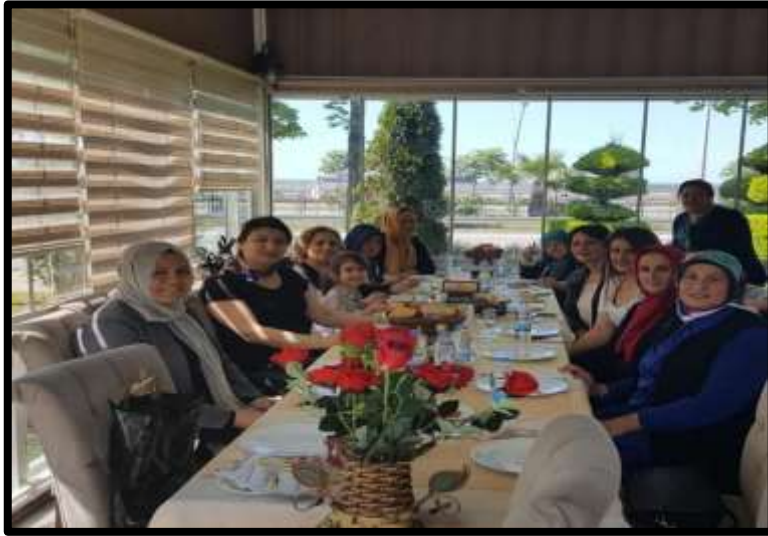
Restoran ve kafelerde gerçekleştirilen kadın toplantılarına ait bir görünüm.