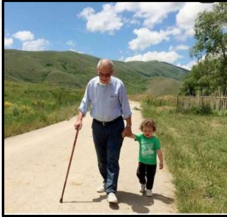
Dede-torun ilişkine ait bir görünüm.