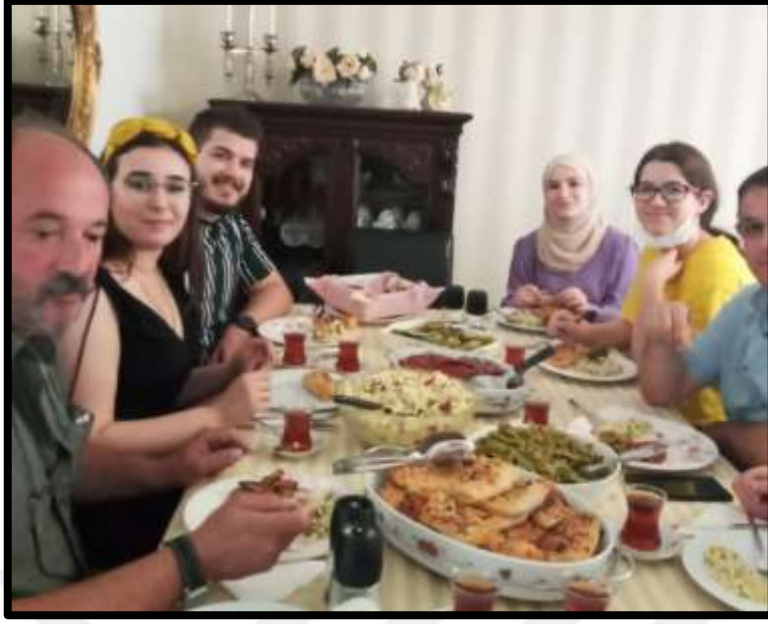
Misafir sofrasına ait bir görünüm.