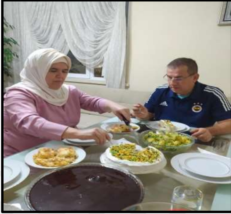
Masa ve oturma düzenine ait bir görünüm.