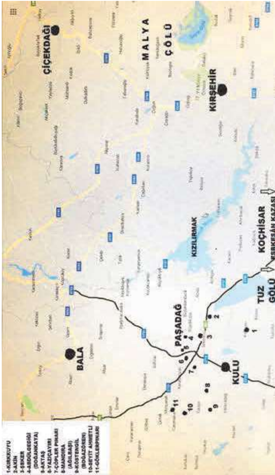
Harita 1: Konya Eyaleti Dâhilinde İskân Edilen Nogay Muhacirlerinin İskân Bölgesi (Haritanın hazırlanmasında yardımcılarından dolayı Dr. Öğrt. Üyesi Mustafa Altunbay'a teşekkür ediyorum.)