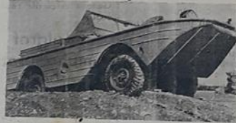
Fabrikadan çıkan hem kara ve hem de denizde giden Jeep arabaları tecrübe edilmek üzere bir deniz kenarına gelirken

kesimlerin çoğunda Alman rücatı bir bozgun halini almıştır.