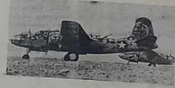
Ağır Kamufij edilmiş bombardıman uçakları Mihver mevzilerini bombalamak üzere bir hava meydanından havalanırken

1500 ölü, 5000 yaralı, 900 ev yıkılmış 2000 evde hasar var