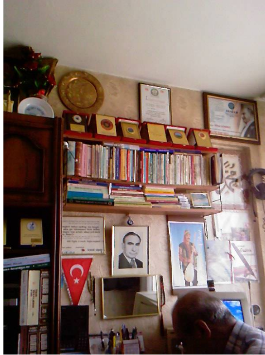
Ozan Nihat, çalışma masasında, 2007