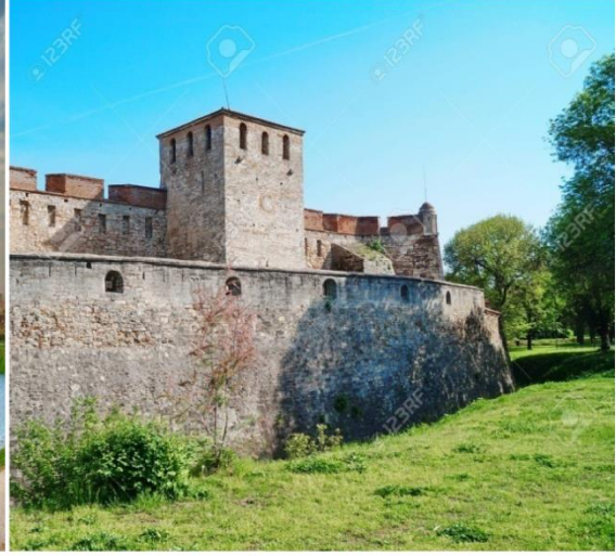
Vidin Kalesi Bulgaristan