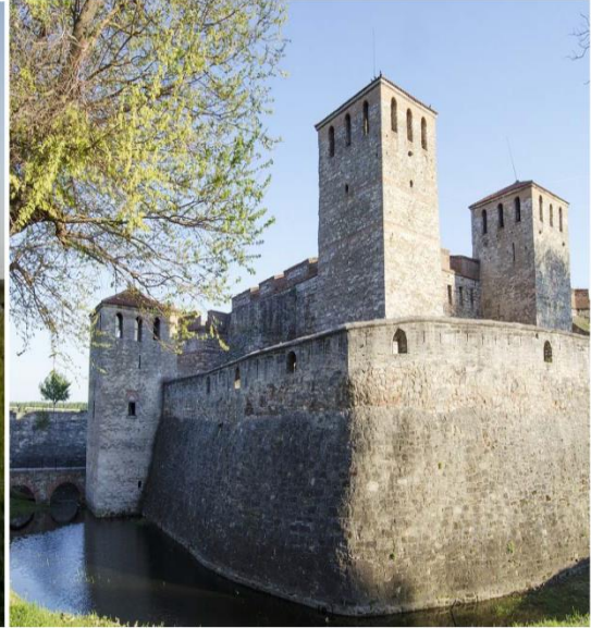
Vidin Kalesi Bulgaristan