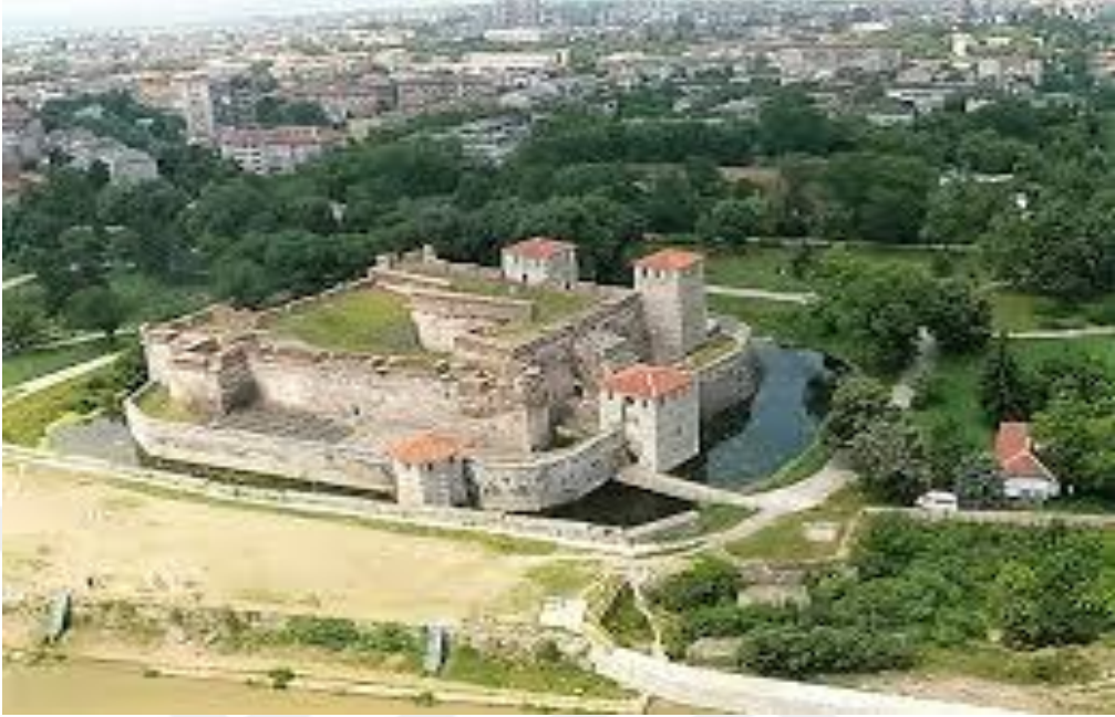
Bulgaristan, kuşbakışı, arkeolojik site, Hava fotoğrafı, Unesco dünya mirası bölgesi, Tuna, Vidin, Kale