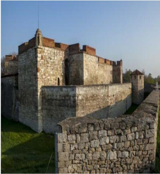
Vidin Kalesi Bulgaristan