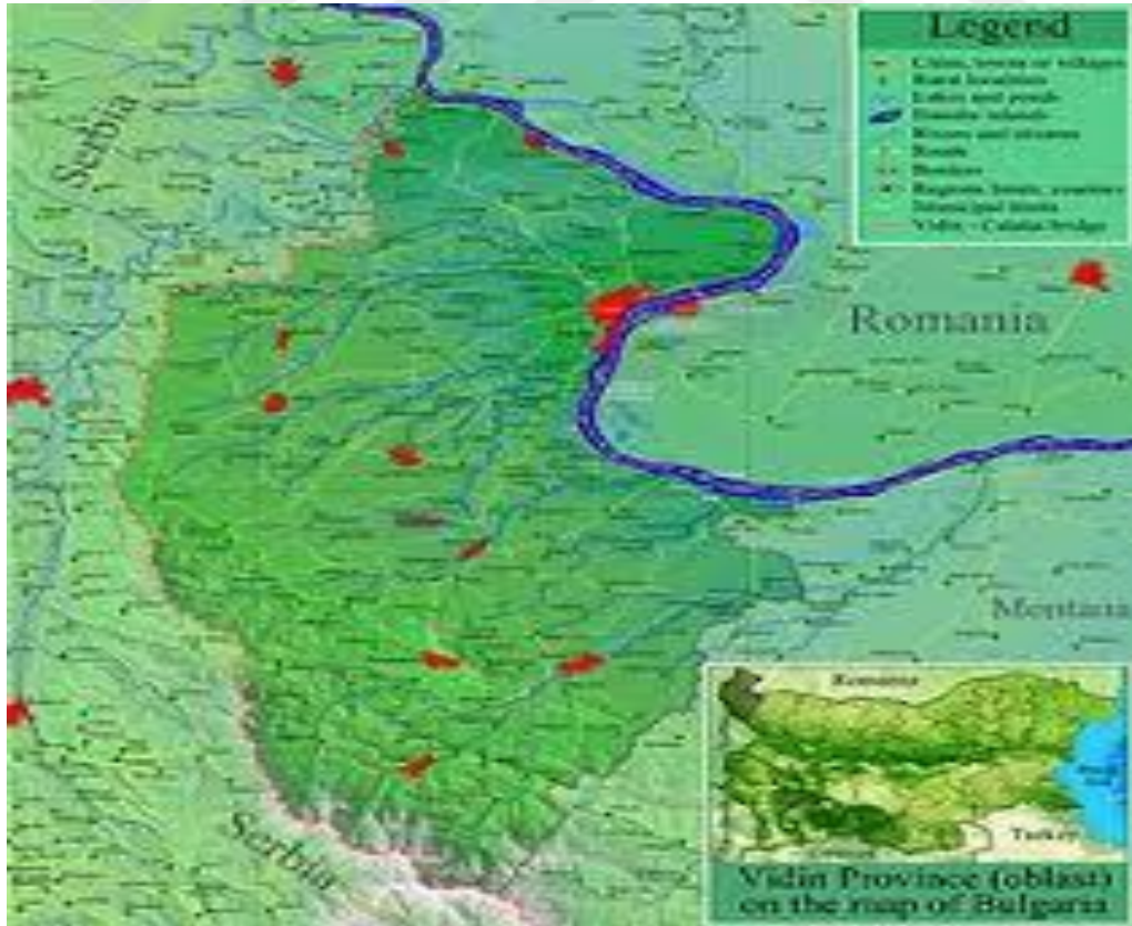
Bulgaristan Vidin Bölgesi Haritası