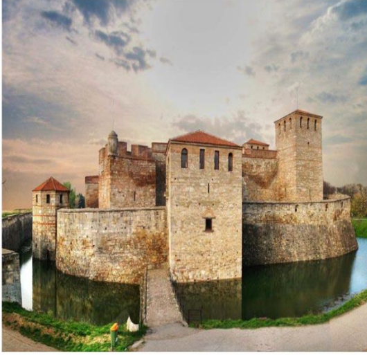
Vidin Kalesi Bulgaristan