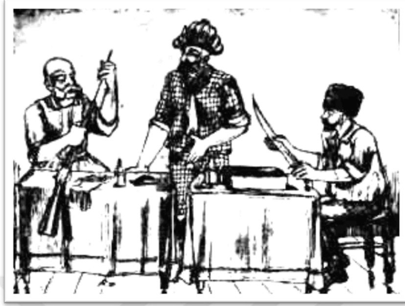
“Karagöz: -Haydi bakalım biraz da sizi seyir edelim.” 113

Karşılıklı iki masanın bir ucunda Rusya, diğer masanın ucunda Avusturya, karşılıklı olarak oturmuştur. Avusturya elinde tüfek tutmuş onu temizlemektedir. Diğer masadaki Rusya ise elindeki kılıcı bilerler. Karagöz ise tam ortalarında ayakta durur ve onların kapışmak üzere olan vaziyetlerini seyre koyulur.