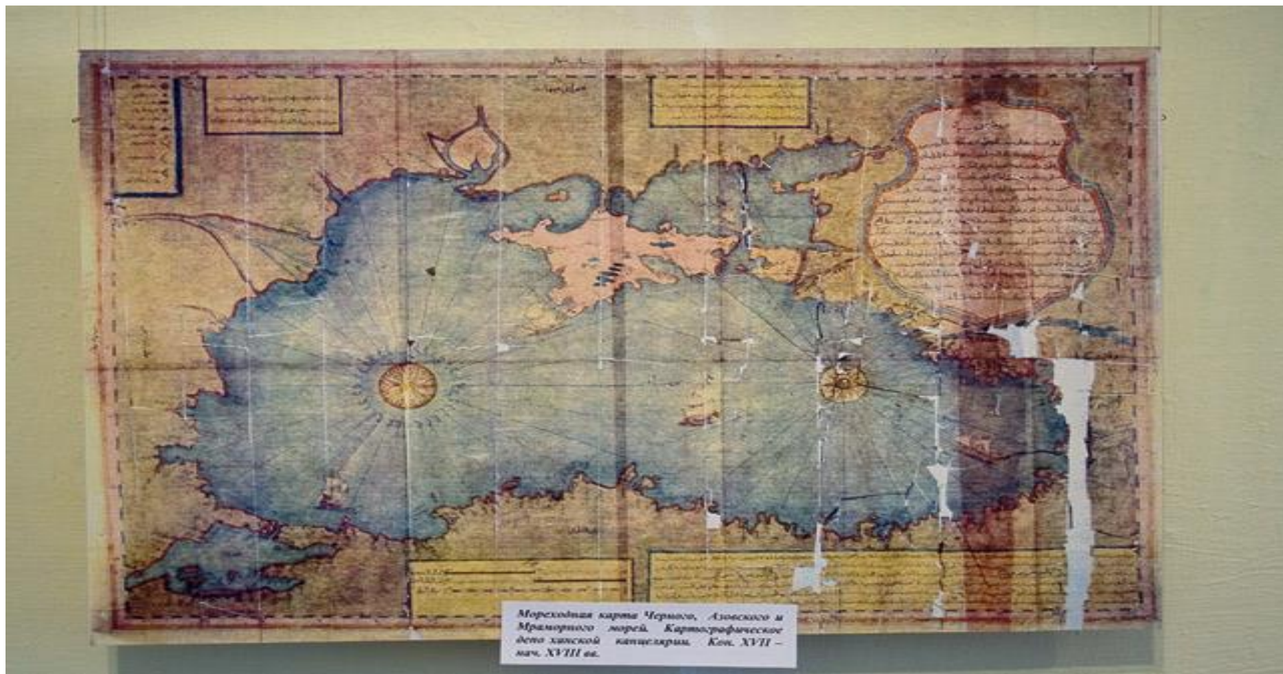
Морская карта Черного, Азовского и Мраморного морей. Картографическое дело казённой канцелярии. Кон. XVII – нач. XVIII вв.