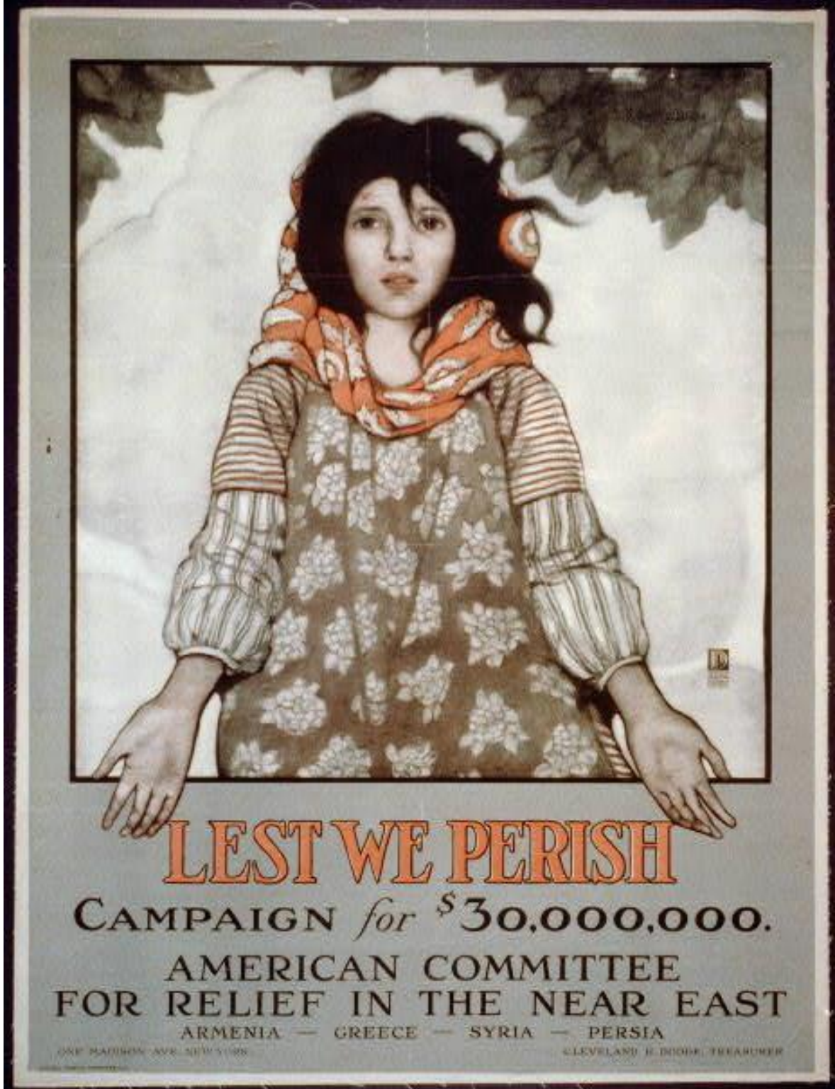
Ek 10: American Committee Relief in The Near East, “ Lets We Perish” Sloganlı Yardım Afişi.