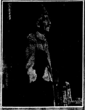
MUHAMMAD VI.—SULTAN OF TURKEY.

The Shadow is More Interesting Than the Man.