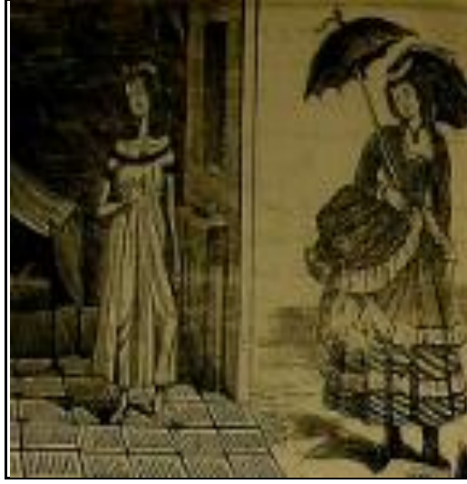
Sokakta, Yatak odasında. 96