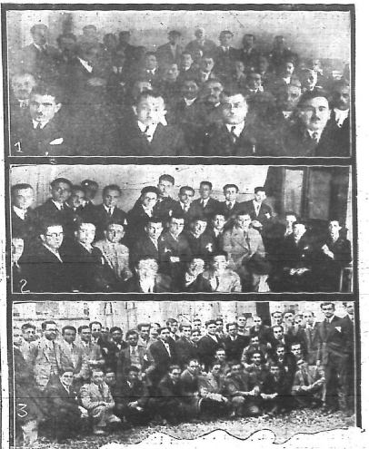
1 - Bakkalların içtimalı — Hukuk talebe cemiyeti kongresinde bulunmaları. 2 - Tıp talebe cemiyetinin içtimalı oturak odaları

Hukuk talebe cemiyeti de dün senelik kongrasını aksettmiştir. Fakat bu içtimal gazetelerle üç gün ilân edilmediği için bir kısım aza kongra- nın toplanamayacağı ileri sürmüşler- dir. Bunun üzerine aza arasında ih- tilaf çıkıp ve bir kısım aza saloni terketmişlerdir. Salonda kalanlardan 12 kişilik bir akaliyet aralarında bir reis seçerek müzakereye devam etmişlerdir.