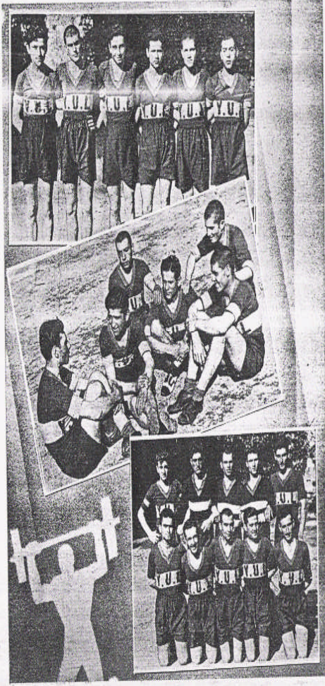
Voleybol ve Futbol takımları