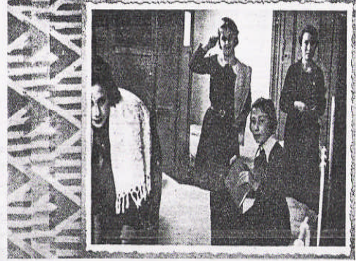
Bir müzakere — Sınıfta — Yatakanede sabah tuvaleti