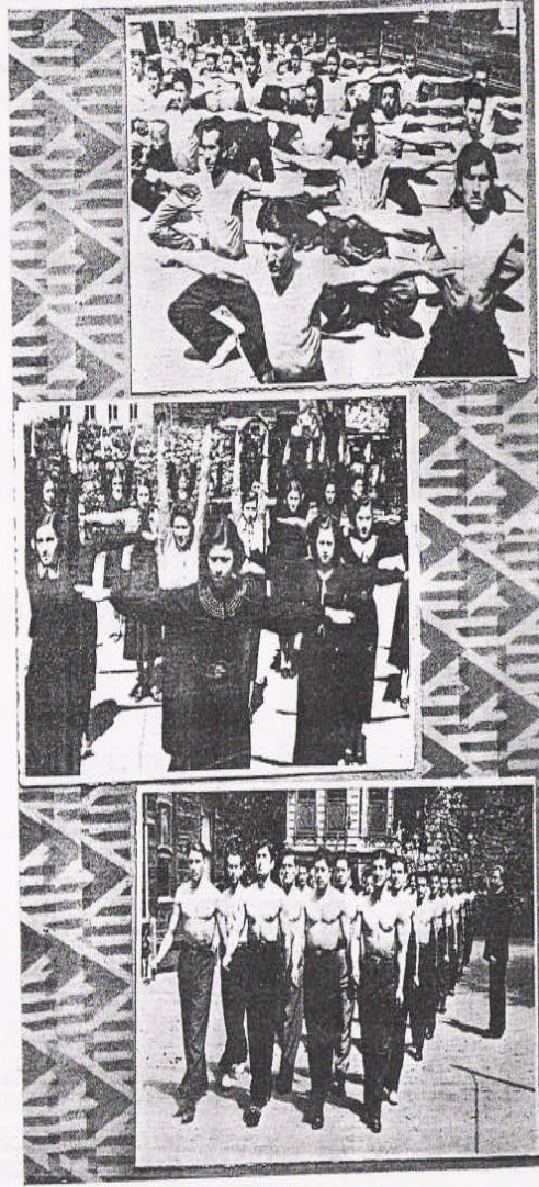
İdman bayramına hazırlık