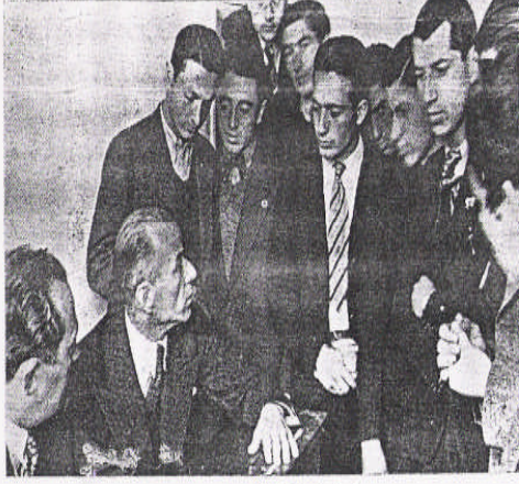
Öğrencilerle bir hasbehal