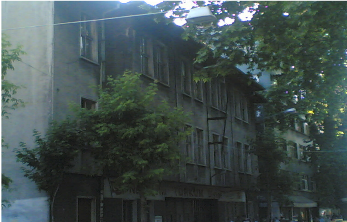
Ek 9: Günümüzde Bir Kamu Binası Olarak Kullanılan Yuca Ülkü Lisesi'nin Görünümü